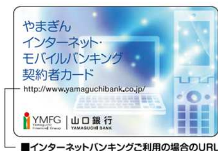
■インターネットバンキングご利用の場合のURL