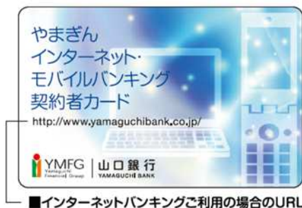
■インターネットバンキングご利用の場合のURL

■契約者番号 やまぎんインターネット・モバイルバンキング専用の契約者番号です。 口座番号とは異なりますのでご注意ください。