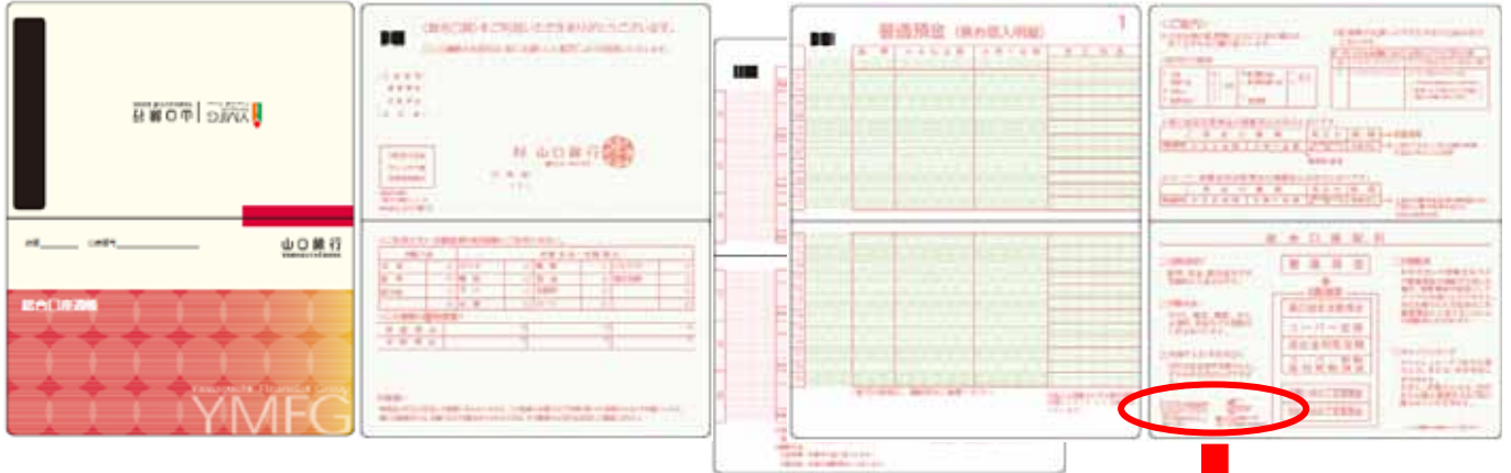
【ユニバーサルデザイン通帳】