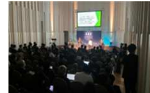
地方創生サミットSAS