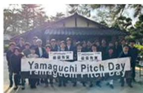
ピッチイベントin松下村塾