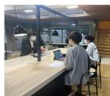
山大Fun Fun Salon