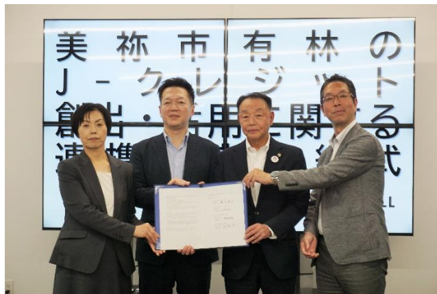
(左から 山口銀行 大本執行役員、YMF Gグロースパートナーズ 禅院社長、美禰市 篠田市長、バイウィル 下村社長)